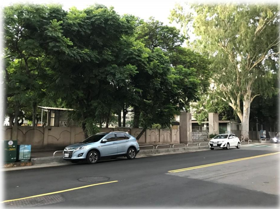
南大路 •尖峰時段臨停車輛密集 •主要幹道 車輛多且壅塞