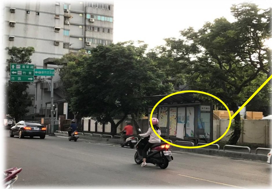
公車亭 •位於基地中間圍牆外