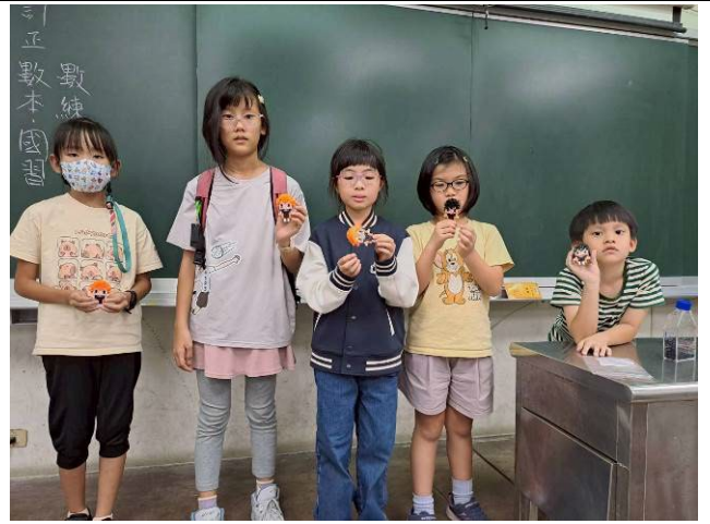
說明：排球少年公仔