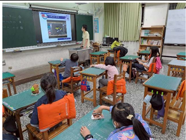
說明：卡皮巴拉造型卡套