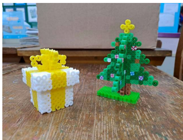
說明：聖誕樹禮盒七彩燈