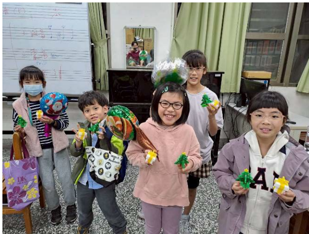
說明：聖誕樹禮盒七彩燈