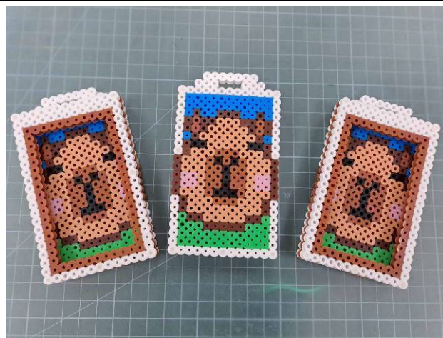
說明：卡皮巴拉造型卡套