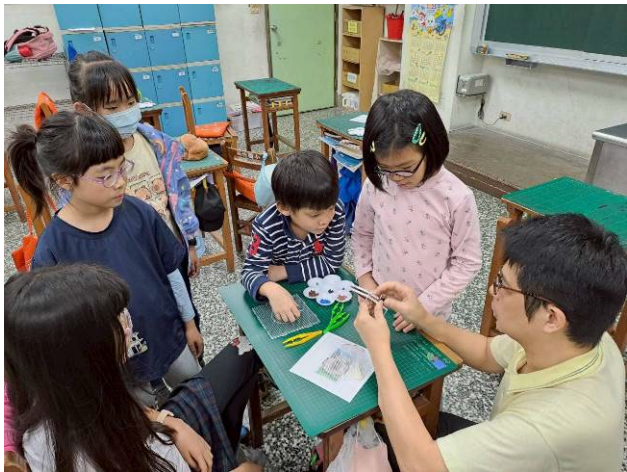
說明：馬力歐食人花公仔-1