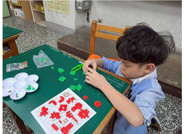
說明：馬力歐食人花公仔-1