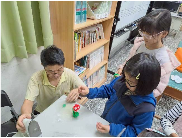
說明：馬力歐食人花公仔-2