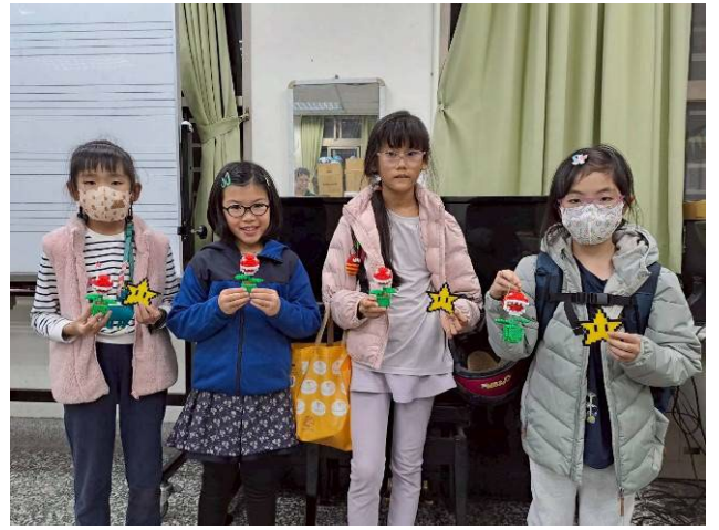
說明：馬力歐食人花公仔-2